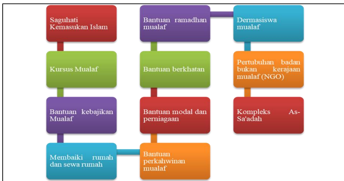
Rajah 2. Skim Agihan Zakat Asnaf Mualaf Di Negeri Sembilan

Bahagian Baitulmal, Majlis Agama Islam Negeri Sembilan (MAINS) telah menyediakan pelbagai bentuk skim bantuan zakat mengikut keperluan asnaf mualaf di Negeri Sembilan.