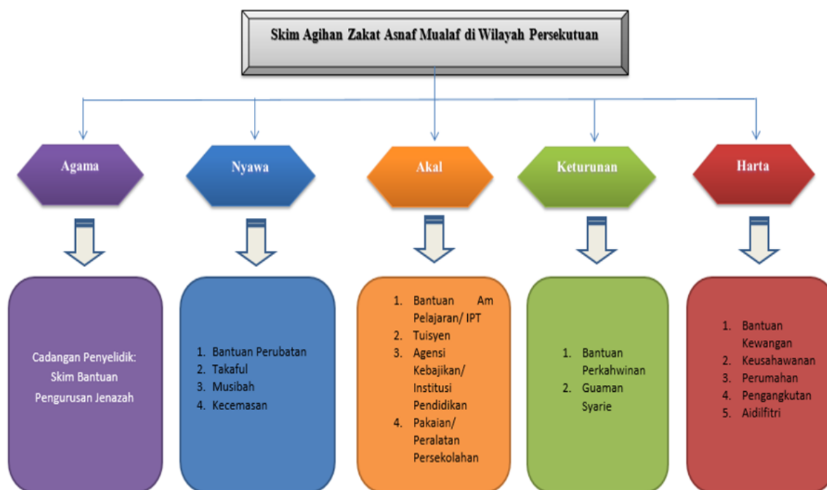
Rajah 4: Analisa Skim Agihan Zakat Asnaf Mualaf Berasaskan Maqasid Syariah Di Wilayah Persekutuan

Rajah 4 menunjukkan skim agihan zakat yang disediakan oleh pihak MAIWP kepada asnaf mualaf di Wilayah Persekutuan. Berdasarkan analisis yang dijalankan, penyelidik mendapati 15 jenis skim bantuan yang disediakan kepada asnaf mualaf tersebut menepati setiap masalah mengikut keutamaan untuk memelihara agama, nyawa, akal, keturunan dan harta.