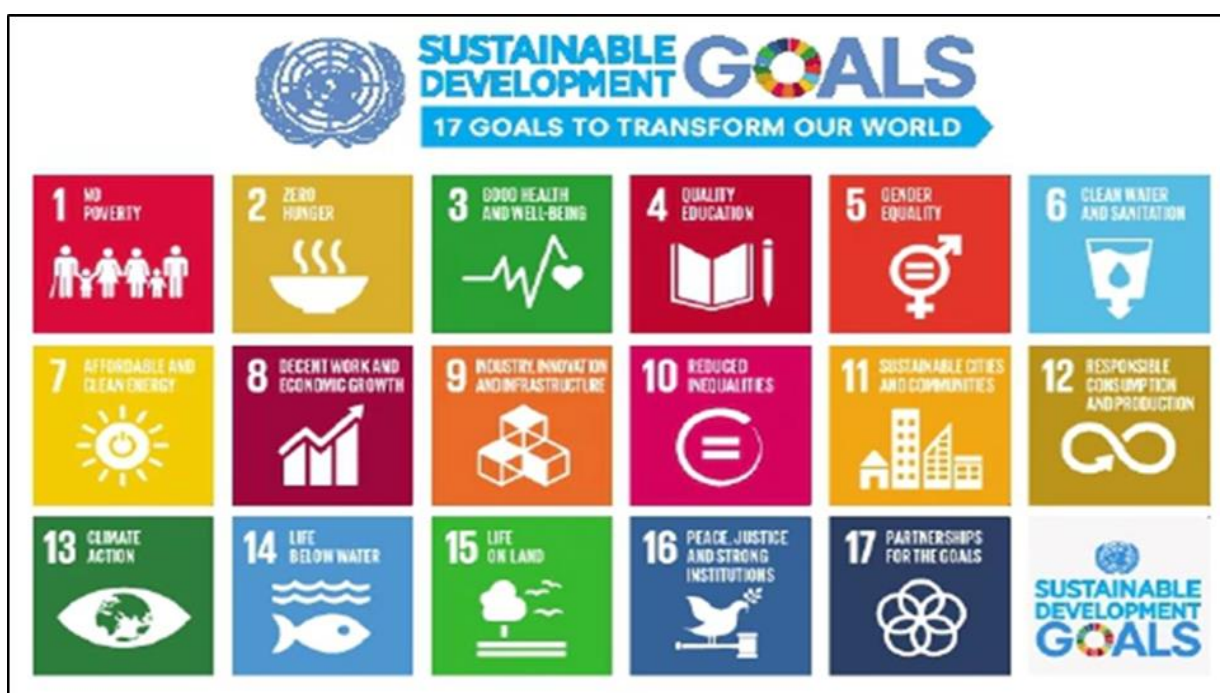
Rajah 1. Matlamat Pembangunan Lestari (SDG)

Matlamat Pembangunan Lestari (SDG) telah diperkenalkan oleh Persatuan Bangsa-bangsa Bersatu (PBB-UN) melalui usahasama global negara-negara anggota dalam bidang Pendidikan (E), Sains (S), Budaya dan Komunikasi (CO). Dengan memperkenalkan 17 matlamat kelestarian global (rujuk Rajah 1), UNESCO berharap agar negara-negara anggota komited ke arah merealisasikan matlamat-matlamat tersebut menjelang tahun 2030.